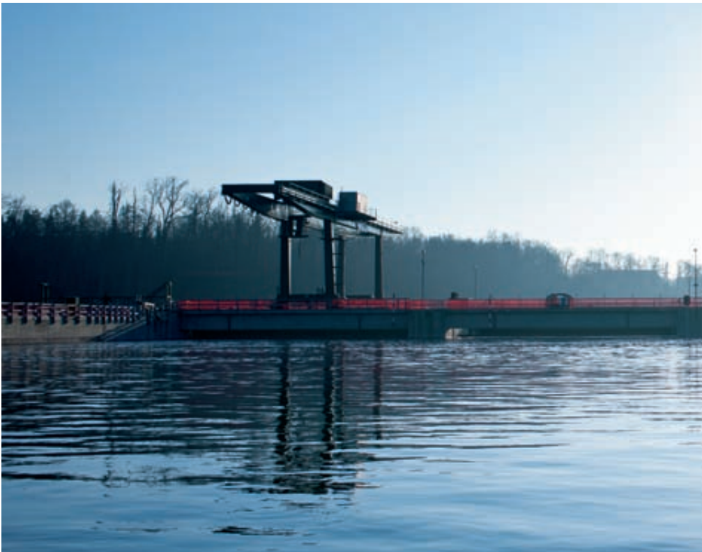
Stauwehr des neuen Wasserkraftwerks Rheinfelden

Die Umweltverträglichkeit ist eine wichtige Voraussetzung für den Neubau. 65 ökologische Einzelmassnahmen tragen zur Einbettung des neuen Kraftwerks in die Natur bei. Dafür investiert Energiedienst etwa 12 Mio. €. Bedeutendste Massnahme ist das naturnahe Fischaufstiegs- und Laichgewässer im ehemaligen Kraftwerkskanal mit einer Länge von rund 900 Metern. Ungezählte Fisch- und Pflanzenarten erhalten hier einen Lebensraum zurück, der ihrem natürlichen Umfeld entspricht. Mit dem Bau des Aufstiegsgewässers wurde im November 2010 begonnen. Im Zuge der Fertigstellung des Maschinenhauses wurde für 1.2 Mio. € aber auch der Fischpass am Schweizer Ufer beim Maschinenhaus einschliesslich des Einbaus eines fischfreundlichen Zählbeckens fertiggestellt.